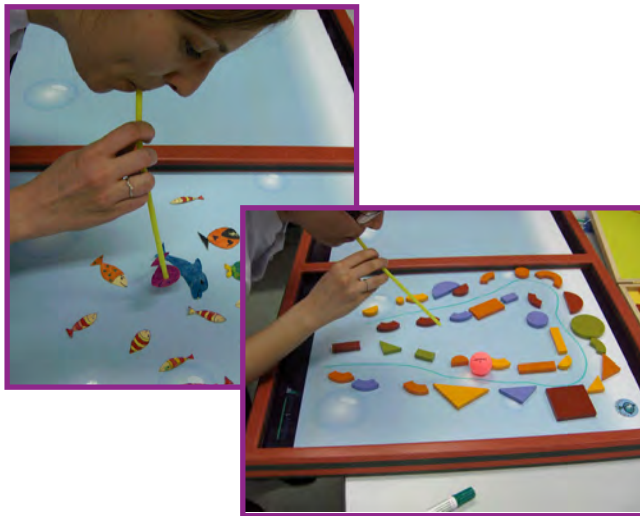
Devenir un champion du souffle.