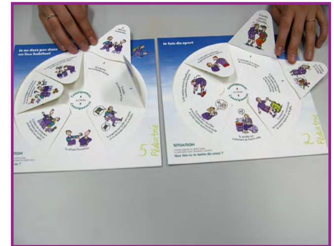
Que faire en cas de crise d'asthme ?