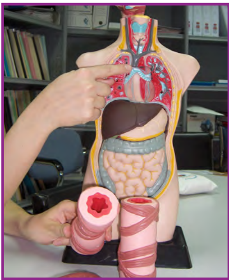
C'est quoi une crise d'asthme ? Que fait l'asthme aux poumons ?