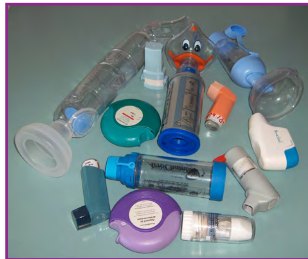
Savoir utiliser les médicaments.