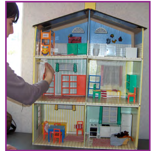
Adapter l'environnement et s'adapter à notre environnement.