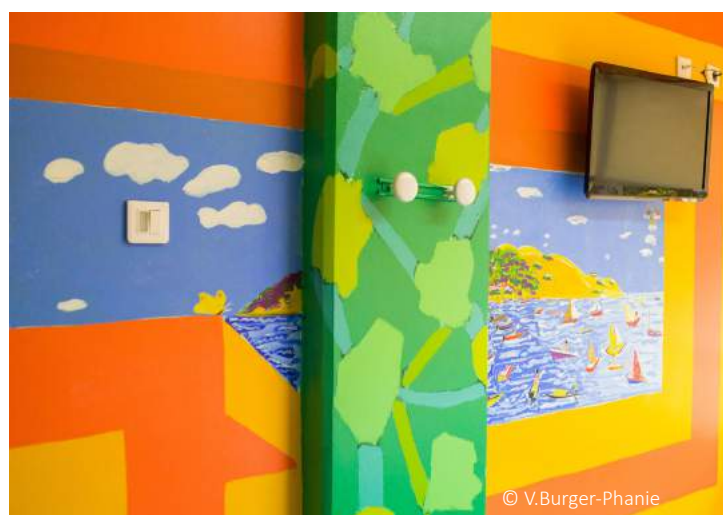
Isidore Krapo - Chambre 27