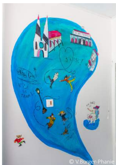
Arnaud Faugas- Chambre 12