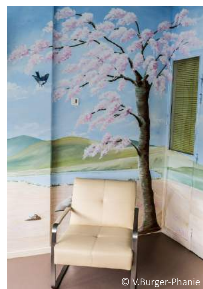
Isabelle Berenger - Chambre 24