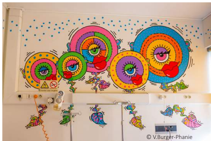
Nadine Sauzede- Chambre 21