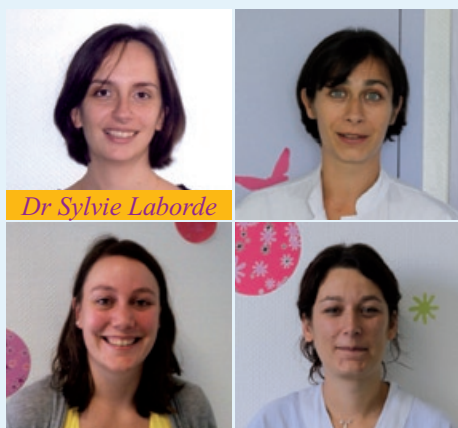
L'équipe pédiatrique du centre douleur chronique

La prise en charge est le plus souvent réalisée en consultations externes, cependant une hospitalisation peut être proposée aux patients présentant les affections les plus sévères en termes d'intensité ou de retentissement, notamment socioprofessionnel. Au terme d'une évaluation pluridisciplinaire, les stratégies thérapeutiques sont choisies en alliance avec le patient.